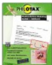
Philotax Gedruckter Plattenfehler-Katalog Bund + Berlin 7. Aufla Artikelnr.: 230-050-00421