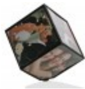
Foto-Würfel rotierend für 6 Fotos Nr. 73514